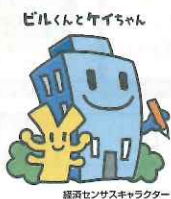
経済センサスキャラクター

平成28年経済センサス-活動調査キャンペーンサイトでは調査の意義を知っていただけるようなコンテンツ「センサス・ノート」や平成28年経済センサス-活動調査のテレビCM等もご覧いただけます。