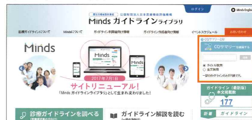
図5：CQサマリー検索ボックス

パソコン表示ではトップページ右側上部(オレンジ色の枠内) ※スマートフォン表示ではページ下部にあります。